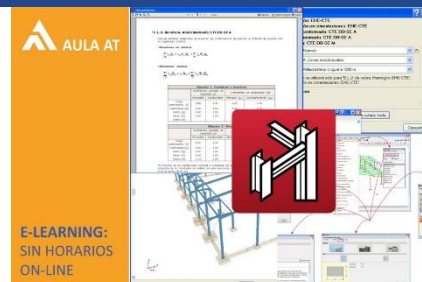
CYPE 3D Cálculo de estructuras metálicas