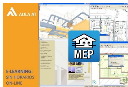
CYPECAD MEP: Diseño y cálculo de instalaciones para proyectos de adecuación de locales