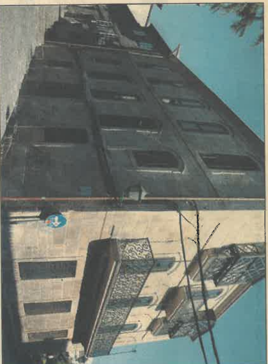
La fachada sur con la entrada principal

servar en una exposición de planos que hay en la propia sede de los aparejadores. La misma muestra incluye una serie de fotografías para comprobar el antes y el después de la casa, un ejercicio que prueba de un vistazo el aporte estético con el que se beneficia el barrio.