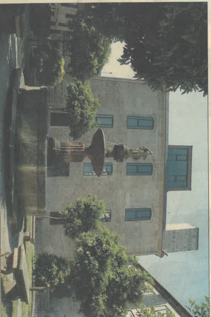
La restauración mejora el aspecto del barrio y las vistas de la Plaza do Peirao // GUSTAVO SANTOS

A pocos metros de la Casa del Varón representa una nueva muestra de la arquitectura clásica de la capital para el visitante