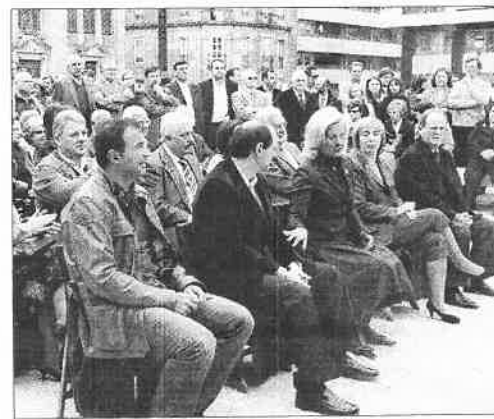
La inauguración contó con una amplia presencia de políticos.