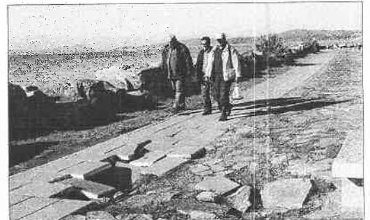
Aspecto de un tramo del paseo de Bouzas.