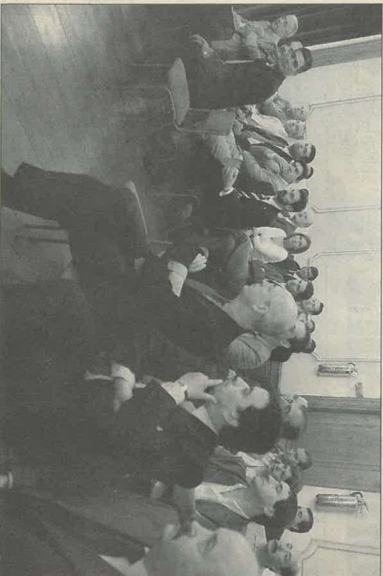
La nueva directiva de la asociación de vecinos 'Santa María' ayer en el Concello