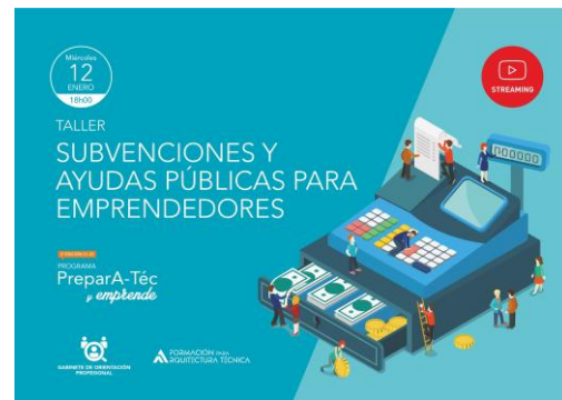
TALLER SUBVENCIONES Y AYUDAS PÚBLICAS PARA EMPRENDEDORES