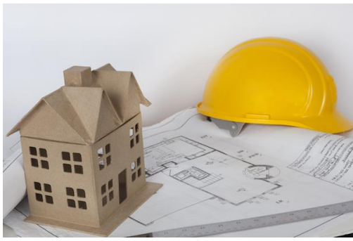
SEGURIDAD Y SALUD EN OBRAS DE REHABILITACION